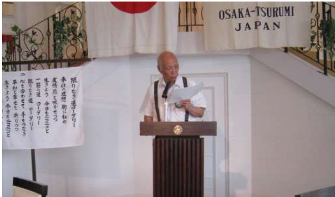
社会奉仕委員会過去の活動