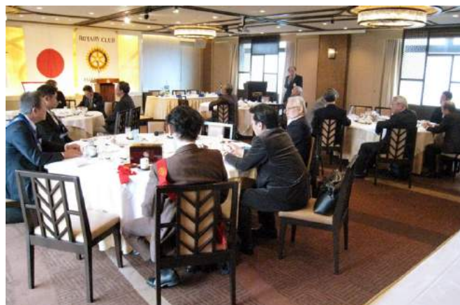
11/26 クラブフォーラム写真