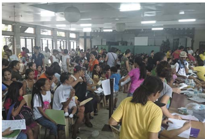
■オペレーション・バースライト（児童の出生登録活動）の様子