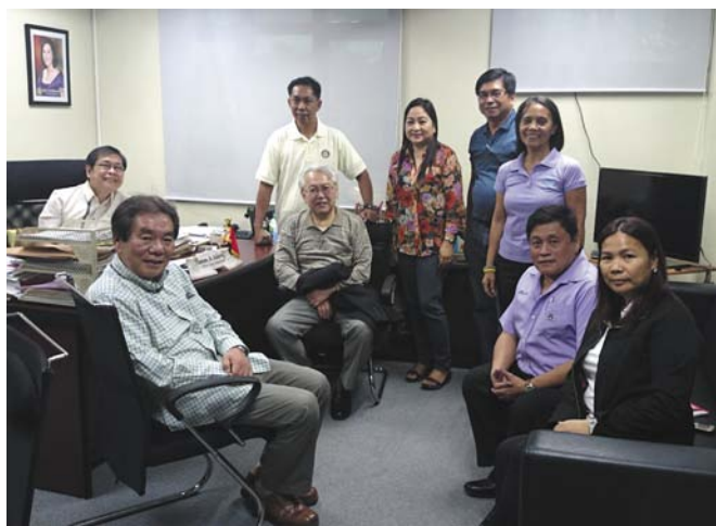
■クバオビジネスセンターRCの皆さんと