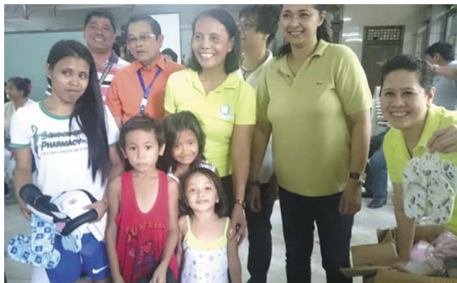
■発さんの寄付による子供用の品々をプレゼント

公式のレターが来るようでしたら、本年度の国際奉仕委員長と相談しながらご案内したいと思います。