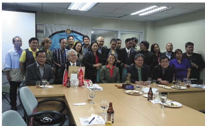
■クバオビジネスセンターRC例会参加者 例会の後はお酒も出て、ノリノリのカラオケ大会でした。