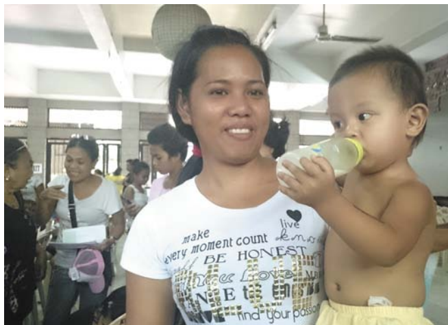
■お母さんと子供の笑顔が最大の報酬です。