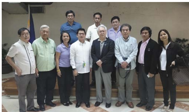
■ケソンシティ市長と3780地区RCの皆さん