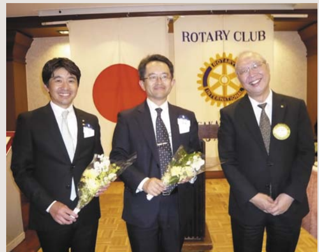
大阪東ロータリークラブ