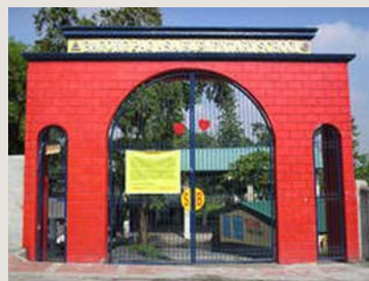
bagong pagasa elementary school quezon city