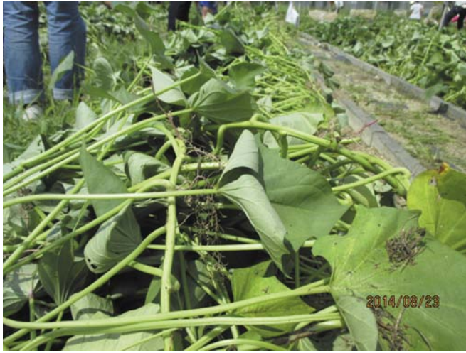
③つる返したイモ畑