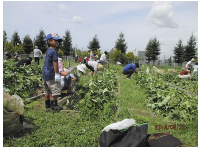
①家族での雑草抜き

先日の23日に鶴見緑地のサツマイモ畑の雑草取りとイモのつる返しの作業に参加しました。