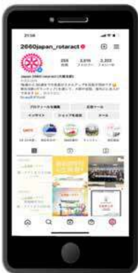
・ 2660 地区 Instagram