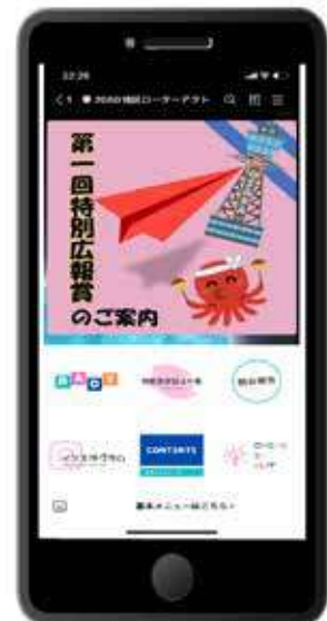
・ 2660 地区 LINE 公式