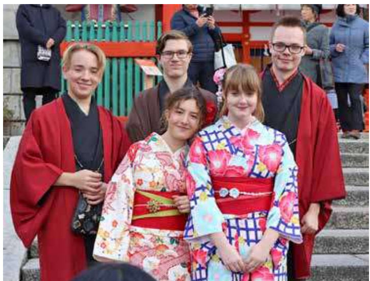
来日学生 日本文化体験