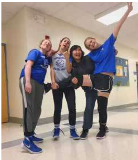
派遣学生の学校での様子