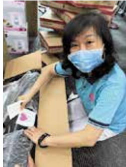
学友会寄贈の印を貼る黄会長

さらに1月には、同学友会中央支部(クアラルンプール)がフル・ランガット地区被災者のために約5,000リンギット分の