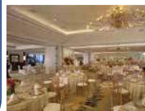
マイレボールルーム