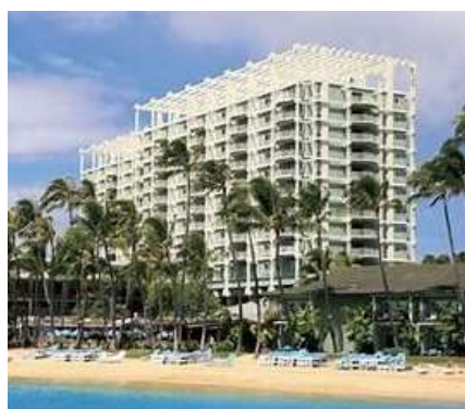
ザ・カハラ・ホテル&リゾート