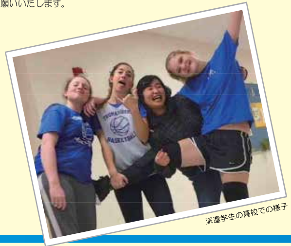
派遣学生の高校での様子

「青少年交換要覧」 http://riiyc.org/document/yectebiki.pdf を参照下さい。また、地区委員会で開催するオリエンテーションに必ずご出席下さい。クラブの内外で、来日学生のホームステイ先であるホストファミリーの確保をお願いいたします。