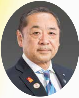
2018～2019年度 国際ロータリー 第2660地区 ガバナー 山本 博史