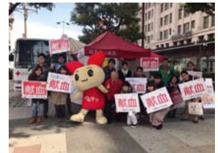
今回はけんけつちゃんも呼びかけに参加し、大成功の第二回地区献血となりました