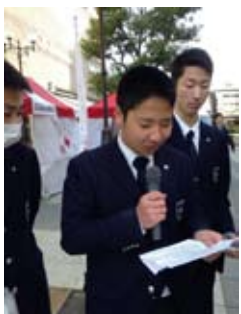
インターアクターも呼びかけ (清風高等学校 IAC、高槻中学校・高等学校 IAC)

この活動が今後も継続し、1人でも多くの命を救う事となればと願っております。今回の献血活動に参加して下さった皆様、また応援して下さったすべての皆様、本当にありがとうございました。