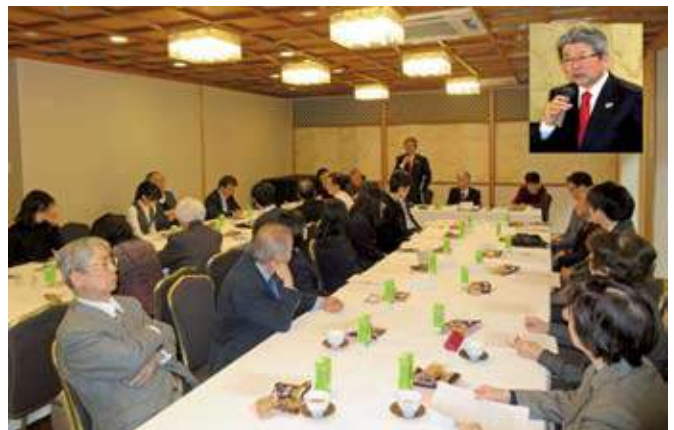
(本文執筆に当たり「小学校学習指導要領解説 総則編(抄) 平成27年7月 文部科学省」を参考にした)

ガバナーも冒頭の挨拶で言われた「子供にとって見本となるべき大人の社会に職業倫理や道徳に欠ける事象が散見される」という問題についても、職業奉仕、過重労働、ネット社会の問題も含めて、かなりの時間をかけて話し合った。詳細は後日発表する本フォーラムの報告書をご覧いただければ幸いである。