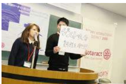
マニフェスト発表の様子

最後に今回この行事を準備して下さいました大阪御堂筋本町ローターアクトクラブの皆様、提唱ロータリークラブの大阪御堂筋本町ロータリークラブの皆様、そして様々なご指導頂きました地区ローターアクト委員会のご協力に感謝申し上げ、「地区連絡協議会」のご報告とさせていただきます。