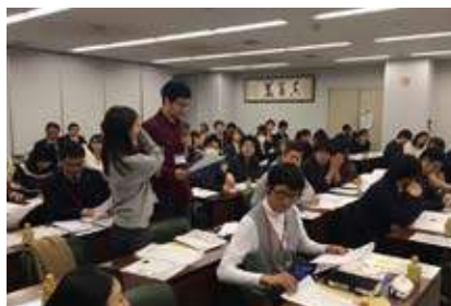
メインプログラム中の様子