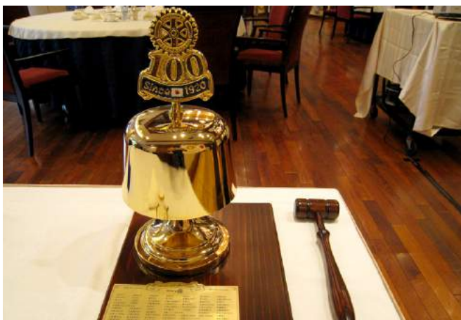
日本ロータリー100周年記念ゴング