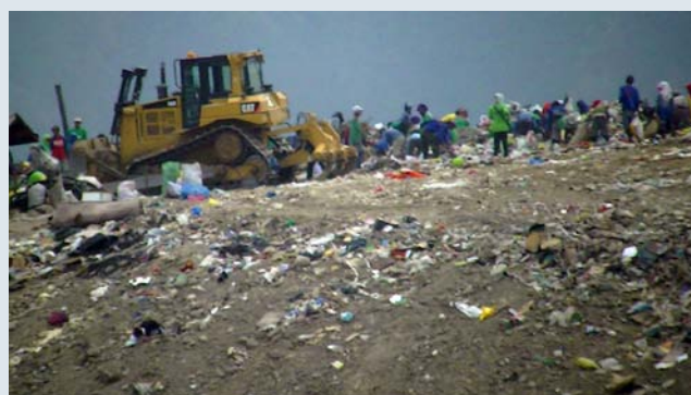
▲スモークバレーのゴミ棄場