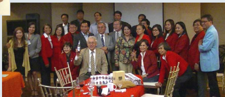
▲クバオ地区RCの合同例会の様子