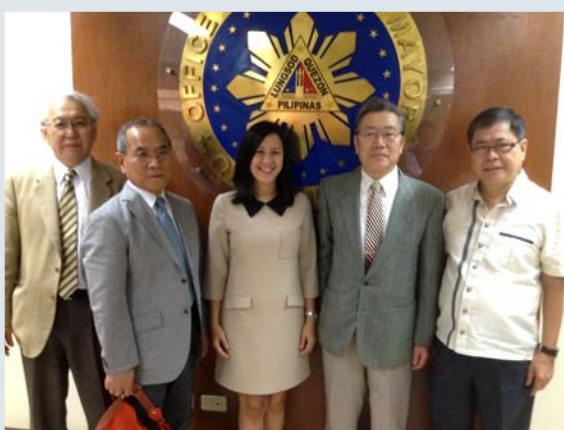
▲ケソン市副市長との面会