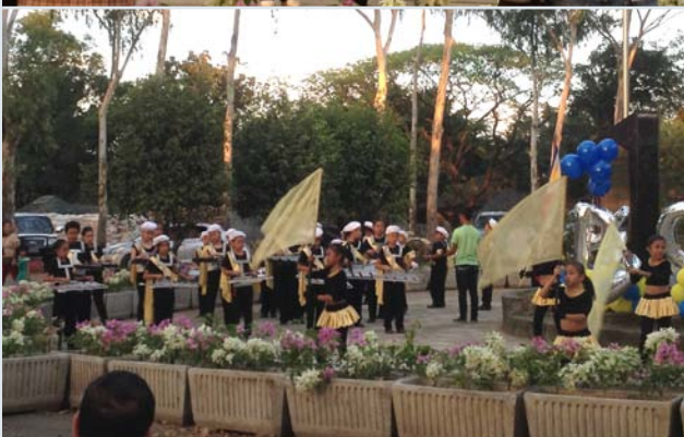
▲ロータリー記念式典の様子