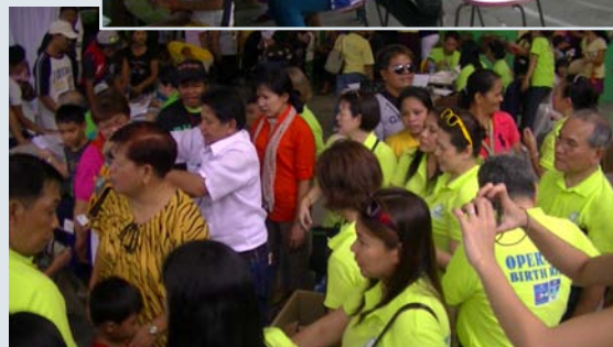
▲国際奉仕活動の様子