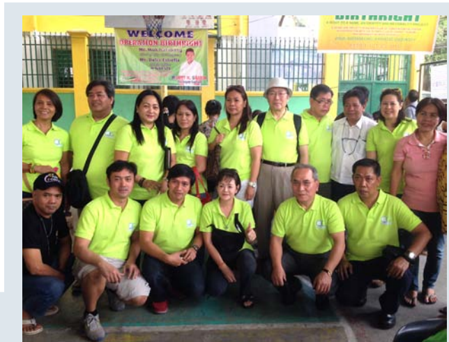
▲奉仕活動にスタンバイ