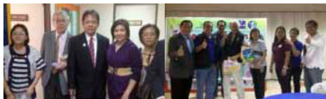
地区ガバナー、地区委員の皆さんと ケソン区役所での活動後に皆さんと