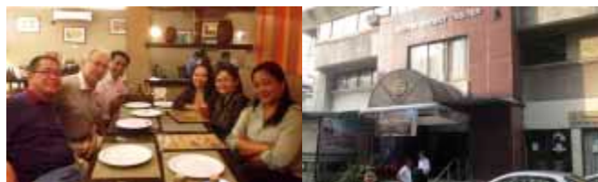
到着日にクバオBCロータリーの皆さんと夕食 ディストリクト3780ケソンロータリービル