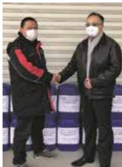
学友会名を記載した支援物資

新型コロナウイルスの感染拡大を受け、上海米山学友会では会員から寄せられた義援金をもとに、相次いで支援活動を展開しています。まず1月25日には、N99型マスクを武漢協和病院へ寄贈。つづいて27日には、学友のついで協力者を得て、次亜塩素酸消毒薬1トンを湖北省の2つの施設へ寄贈しました。28日には、日本製医療用マスクを購入し、湖北省の3病院へ送りました。このほか、倉敷RCおよび徳島RCから支援の打診を受け、中国国内で現状不足している物資や、支援を待っている病院を紹介するなど、日本からの支援の橋渡しも行っています。