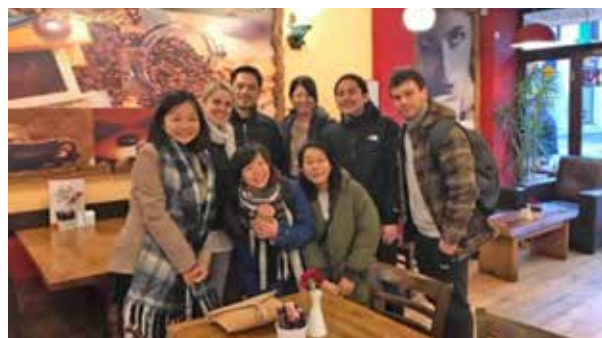
同じく前年度・本年度のグローバル奨学生との集合写真。 定期的な交流を通して、お互いの学業分野について情報交換 をしています。