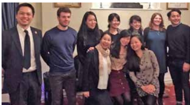
前年度・本年度のグローバル奨学生との集合写真。 ブライトン地区RC事務所で開催された 「RCグローバル奨学生夕食会」にて(2月21日付)

残りの留学期間、全力で卒業研究に取り組みたいと思います。改めて、このような機会をいただきありがとうございます。