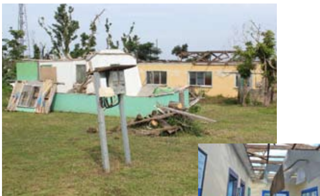
倒壊したスタッフハウス (2015)

これで2660地区「バヌアツ共和国サイクロン義援金」の全てのミッションが完了致しましたことをご報告致します。