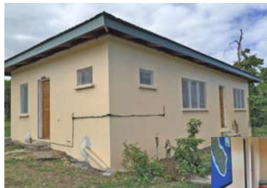
修復されたスタッフハウス (2016)